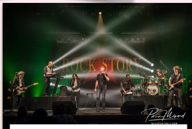
Rock Story Samedi 18 mars