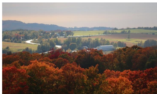
Calendrier Sainte-Sophie-d'Halifax 2021