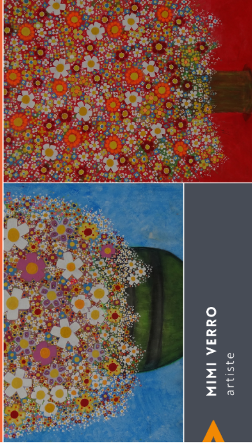
MIMI VERRO artiste